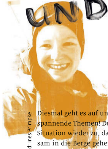
Text und Bild: Ines Primpke

Diesmal geht es auf unseren Jugendseiten wieder um spannende Themen! Denn endlich lässt es die Corona-Situation wieder zu, dass wir uns treffen und gemeinsam in die Berge gehen. Die Jugendgruppen unserer Sektionen machen aber nicht nur die Bergwelt unsicher, wir geben jungen Menschen auch eine Stimme: Im Juli fanden die Jugendvollversammlungen von beiden Sektionsjugenden statt. Außerdem erklärt Max, wie und wann alle Menschen unter 18 ihre Stimme bei der U18-Bundestagswahl abgeben können.