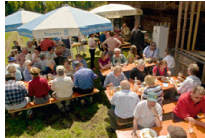
... und auf der Kloaschualm deren festliche Einweihung nach der Sanierung unter Oberländer Obhut