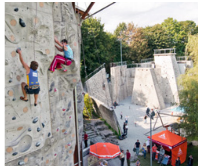
Die Münchner Stadtmeisterschaft zieht Jahr für Jahr mehr Aktive und Zuschauer an

Neben der »alpinwelt« war sicher der gemeinsame Internet-Auftritt der Sektionen München und Oberland einer der Kommunikationswege schlechthin. Das Portal verzeichnete teilweise über 100.000 Besuche pro Monat, und im gesamten Jahr wurde die Millionen-Schallmauer nur knapp verfehlt. Dies bedeutete einen Anstieg von ca. 26 Prozent gegenüber dem Vorjahr. Das Team um unseren Chefredakteur Frank Martin Siefarth arbeitet beständig daran, dieses für uns immer wichtiger werdende Medium weiterzuentwickeln. Doch auch der ideelle Bereich wurde bei aller Begeisterung für medienwirksame Auftritte nicht vergessen. Gemeinsam mit dem Verein zum Schutz der Bergwelt veranstalteten die beiden Sektionen im Mai ein beachtetes (Fach-)Symposium zur Almwirtschaft. Über 100 Teilnehmer aus Behörden, Verbänden und Vereinen fanden den Weg zur