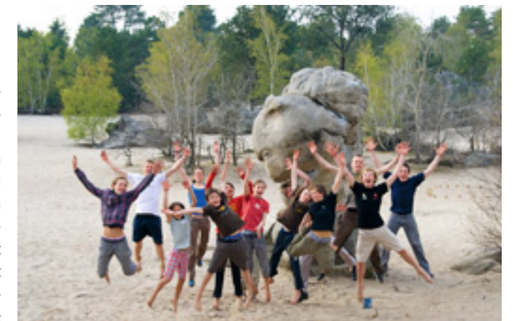
Das „Kletterteam München & Oberland“ ist eine echte Erfolgsgeschichte