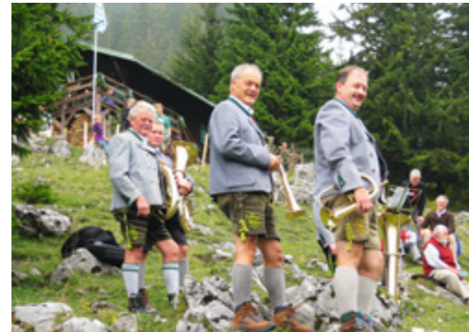
Auf der Siglhütte wurde deren 70-jährige Zugehörigkeit zur Sektion Oberland gefeiert ...

Erfreulich lief das Jahr 2009 für unsere Selbstversorgerhütten . Hier ist im vergangenen Jahr wieder einmal viel passiert! Die Siglhütte feierte wie erwähnt 70 Jahre Zugehörigkeit zur Sektion Oberland – an