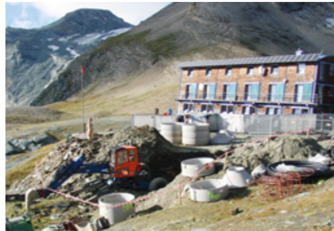
Das Umfeld der Stüdlhütte war zeitweilig eine Großbaustelle

Mit der DAV Summit Club GmbH haben wir einen neuen Partner v. a. für den Bereich Fernreisen gefunden. Die Zusammenarbeit der Sektionen München und Oberland mit dem Summit Club verläuft übrigens