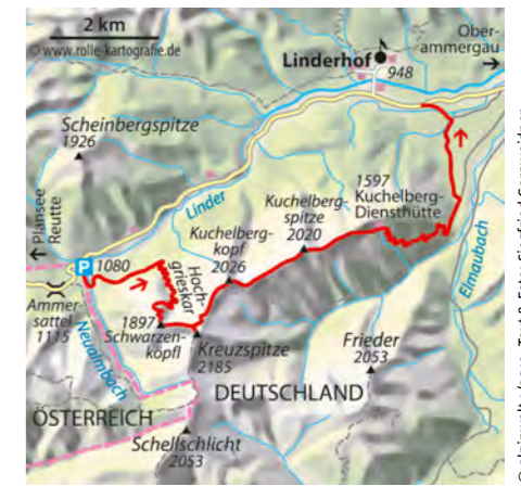
© alpinwelt 1/2019, Text & Foto: Siegfried Garmwieder

Kuchelberg-Diensthütte und in Kehren zu einer Forststraße hinunter. Zweimal links abbiegen und zur Staatsstraße hinaus, die in der Nähe von Linderhof erreicht wird. Mit dem vorher abgestellten Fahrzeug oder per Anhalter zurück zum Ausgangspunkt.