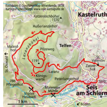
© alpinwelt 1/2019, Text: Franziska Baumann, Foto: © Pfliegerhof

und nach dem folgenden Gehöft rechts und zum Pfliegerhof hinunter. Von diesem geht's am Vigiler Heubadl vorbei und nach 20 Min. links zur Malenger Mühle. Ein Fußweg führt oberhalb des Frötschbachs Richtung Seis bergauf und zum Peterlungerhof. Dort rechts in den Valzurasteig und den Wegweisern in den Ortskern von Seis folgen.