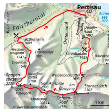
© alpinwelt 1/2019, Text & Foto: Michael Reimer

ten. Es folgt ein aussichtsreicher Höhenweg in stetem Auf und Ab an der Südseite von Ochsenkopf, Gamskarspitze und Kaserjoch. Am Felsaufbau der Rappenspitze beginnt der Abstieg durch ein steiles Schuttkar gen Norden, das im Mai meist noch mit evtl. heiklen Altschneefeldern (im Zweifelsfall auf der Anstiegsroute nach Pertisau zurückkehren!) bedeckt ist. Etwas unterhalb führt der Steig zwischen Hirschensteig- und Dristen-