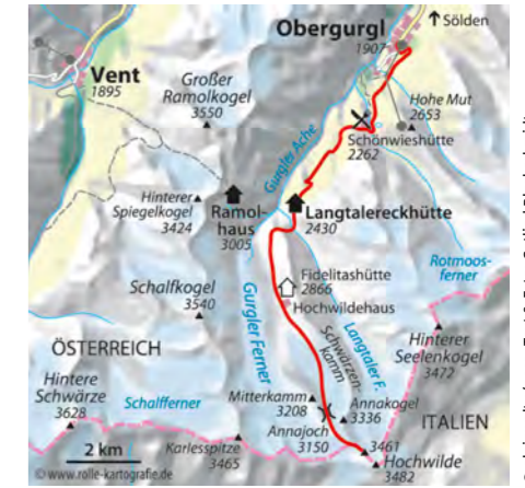
© alpinwelt 1/2019, Text & Foto: Gotlind Bleichschmidt

Zustieg kann je nach Verhältnissen schwierig sein. Dann geht's über versicherte Felsstufen, eine Scharte und Platten zur Hochwilde. Der Abstieg verläuft auf dem Aufstiegsweg (Vorsicht auf tagsüber angeschwollene Gletscherflüsse!).