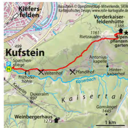
© alpinwelt 1/2019, Text: Redaktion alpinwelt

das Ziel ist bereits in Sicht: kurz noch geradeaus, dann auf ein paar letzten Kehren hinauf zur Vorderkaiserfeldenhütte. Rechts oberhalb der Hütte befindet sich in einem eingezäunten Bereich der Alpenpflanzengarten.