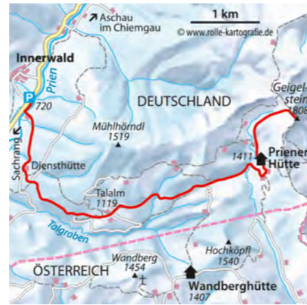
© alpinwelt 1/2019, Text & Foto: Andrea und Andreas Strauß

dem Geigelstein. Im Rechtsbogen aufwärts bis zum Sattel nördlich des Geigelsteins, dann rechts über den Nordrücken bzw. die Nordwesthänge zum Gipfel (bei geringer Schneelage aus Umweltschutzgründen Skidepot am Sattel). Abfahrt über die Aufstiegsroute.