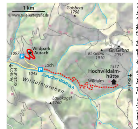
© alpinwelt 1/2019, Text: Redaktion alpinwelt

Tierparkbewohner, gibt Kindern viel Raum zum Aus-toben und Entdecken.