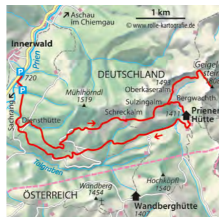
© alpinwelt 1/2019, Text & Foto: Andrea und Andreas Strauß

hang und die Latschenflanke hinauf zum Gipfel des Geigelsteins. Für den Abstieg zurück bis zur Oberkaseralm, hier links und an der nahen Kreuzung wieder links hinab zur Bergwachthütte. An dieser vorbei und auf einem Fußweg nach Süden zur Priener Hütte hinab. Von hier westwärts bis zum Forsthaus kurz über dem Talboden von Sachrang und schließlich auf dem Aufstiegsweg zurück zum Parkplatz.